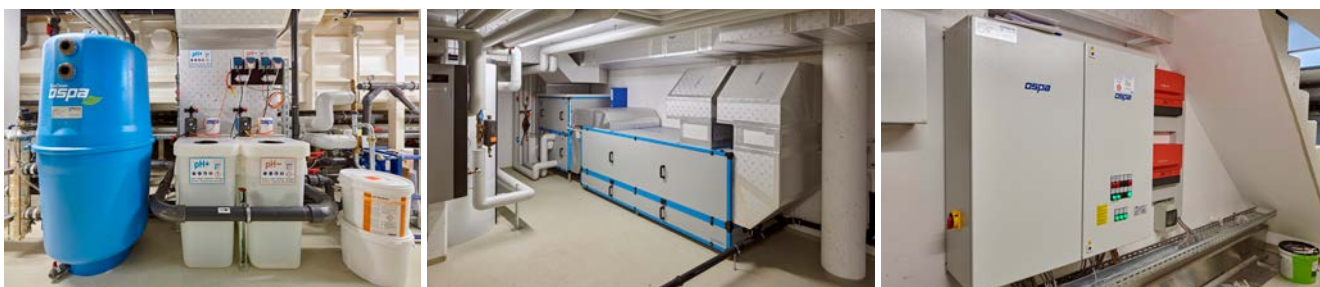
Die Ospa-Schwimmbadtechnik ist eine Ebene unter dem Schwimmbecken installiert und für Revisionsarbeiten gut zugänglich.

Schwimmhalle zu bieten hat: Platz für eine modern designte Sauna mit großer Glasfront und ergonomisch konstruierten Liegen sowie ein Dampfbad in stylischem Design fand sich auch. So ist eine perfekte Rundum-Wohlfühloase entstanden, die keine Wünsche offen lässt. Die kreative Leistung bei diesem Projekt wurde auch schon auf höhere Ebene gewürdigt: So erhielt die Firma Steinbauer für diese Schwimmhalle den bsw-Award 2021 in Silber. Der bsw-Award ist so etwas wie der Oscar der Schwimmbadbranche und wird jährlich in verschiedenen Kategorien an die Schöpfer herausragender Pool- und Wellnessanlagen verliehen. ~