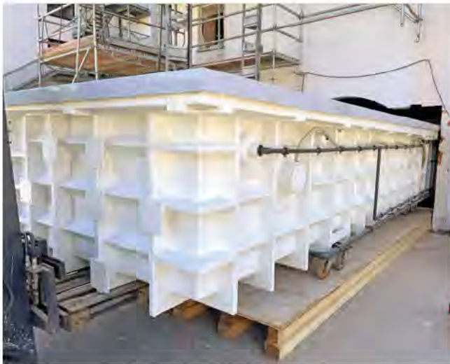
Die PVC-Beckensegmente konnten durch ein ehemaliges Rundbogenfenster in den Gebäudeteil eingeschoben werden.

wasser gespeist. Der große Innen-/Außenpool, der im Sommer mit 28 °C und im Winter mit 30 °C betrieben wird, ist mit Süßwasser gefüllt.