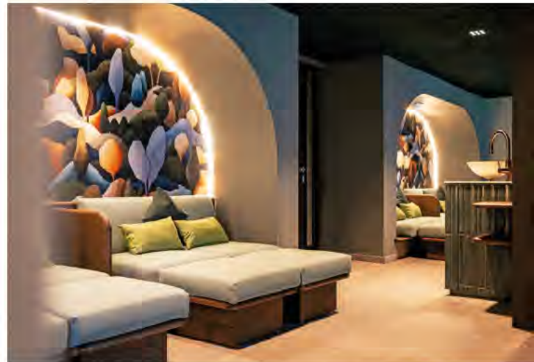
Stilvoll gestalteter, gemütlicher Entspannungsbereich im Spa, der im Rahmen der Umbaumaßnahmen komplett neu gestaltet wurde.

Das Hauptbecken ist innen 8,50 m lang und 4,80 m breit, das Seitenelement misst 2,60 m x 2,50 m. Als Beckenfarbe wählten die Bauherren Silbergrau, das sehr gut zur milchigen Farbe des Thermalwassers passt. Dazu ist der Pool umfangreich mit Wasserattraktionen ausgestattet. Neben einer Einstiegstreppe mit zwei Handläufen sind dies zehn Massagedüsen, sechs in der Längswand und vier in der Einbuchtung, je mit Ansaugung und Taster. Hinzu kommen eine Luftsprudelplatte, fünf Unterwasserscheinwerfer sowie die übliche Technik (Einlaufdüsen, Messwasserentnahme etc.) Im Untergeschoß der Schwimmhalle ist die Ospa-Schwimmbadtechnik revisionsfreundlich und gut zugänglich installiert. Zur