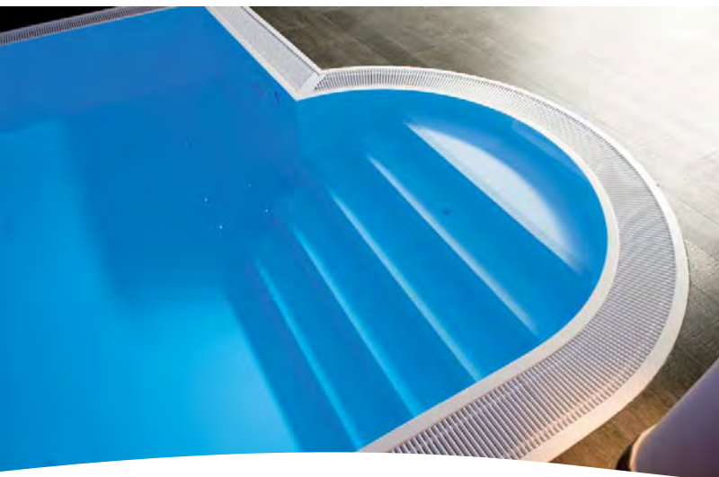
Bild unten Bei Nichtbenutzung des Pools garantiert eine spezielle Rollladenabdeckung, dass keine Wärme unnötig entweichen kann.

Bild Mitte Eine in das Einstückbecken eingepasste Treppe an der halbrunden Seite des neun Meter langen Pools sorgt für einen bequemen Einstieg.