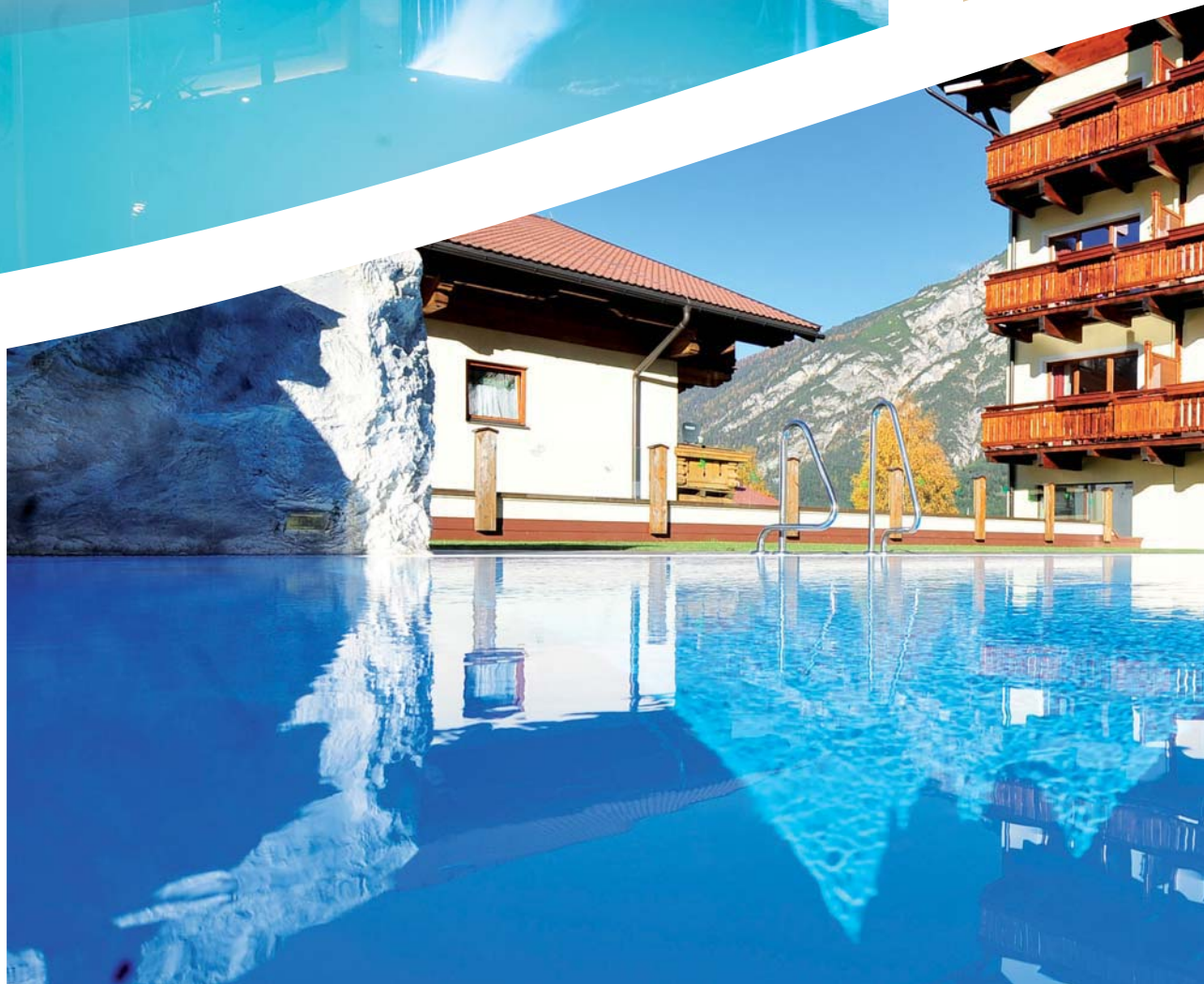
Bild unten Alpen-Charme: Der großzügige Outdoor-Pool des „Hotel Post am See“ fasziniert mit seiner atmeberaubenden Sicht auf die Berge.

Bild links Aus der Sauna des Spa kann man durch große Panorama-Fenster direkt auf den Achensee blicken.