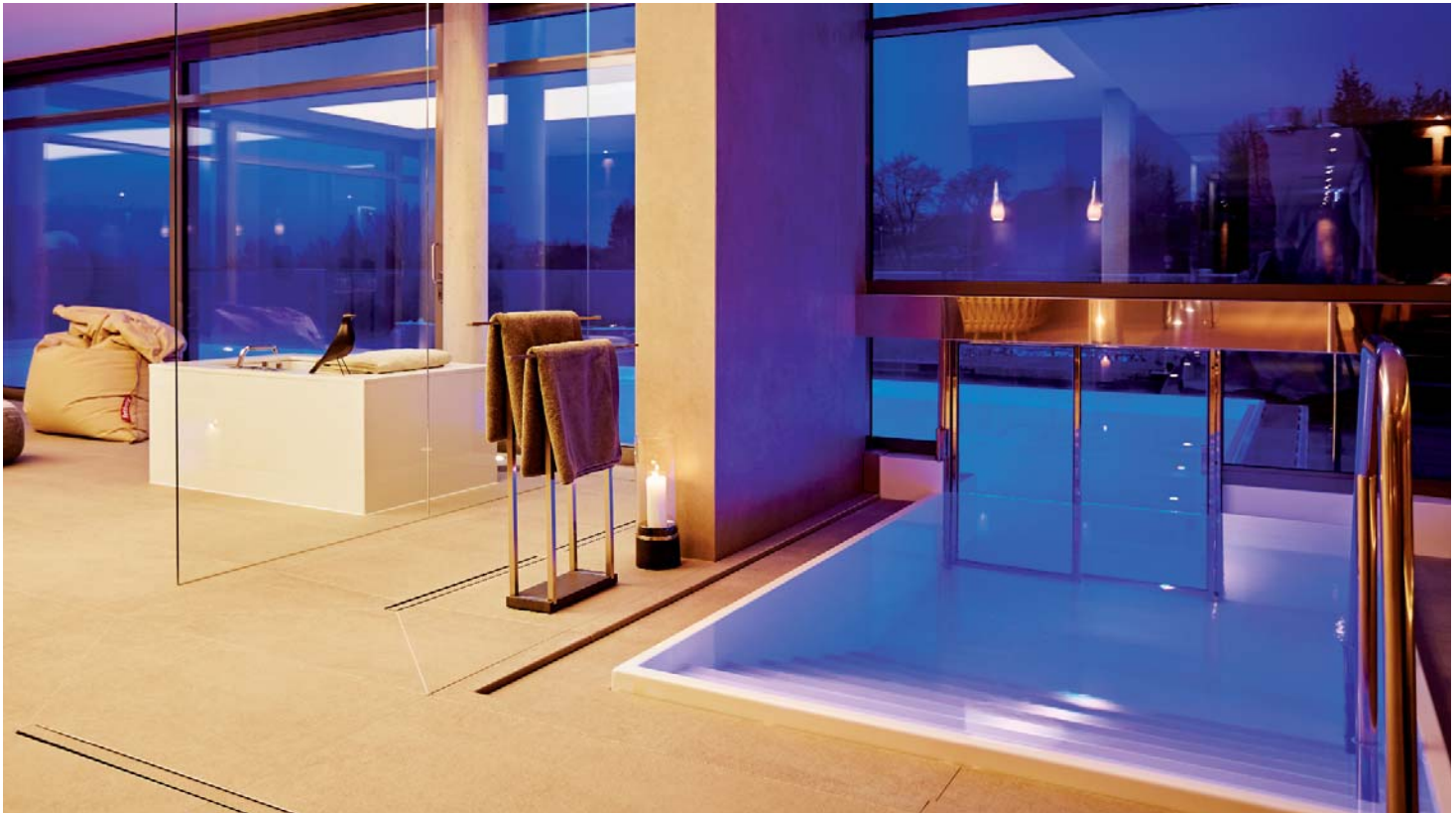
Bild oben Ein besonderer Blickfang ist die Panorama-Glas-scheibe in der Front des Pools. Dabei ragt der Korpus des Beckens rund drei Meter aus dem Gebäude heraus – eine statische Herausforderung, die durch die Spezialisten meisterhaft erfüllt wurde.

Bild unten Den See und die Natur im Blick: Auf dem Dach des „Hotel Seegarten“ lädt der neue, aufwendig gestaltete Pool zum Schwimmen unter freiem Himmel ein.