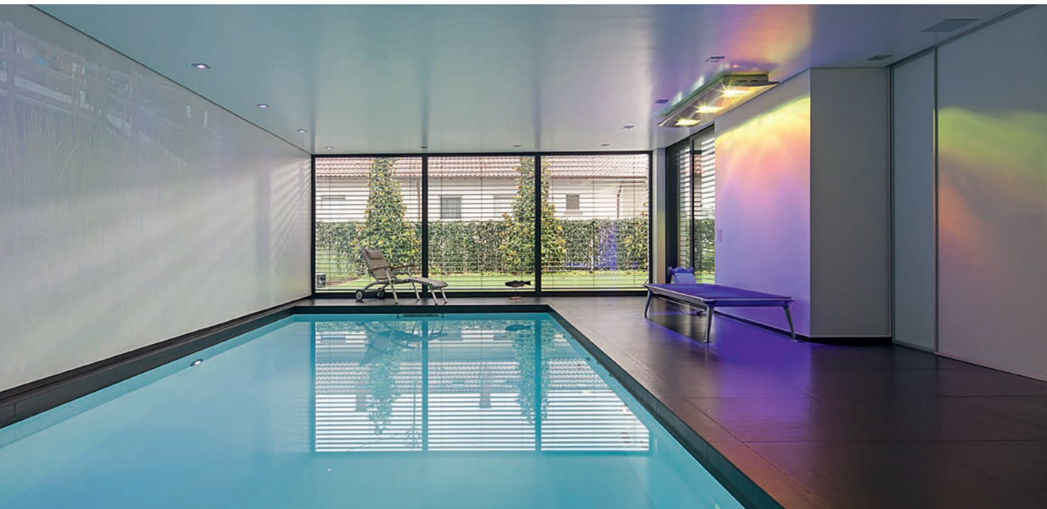
Blick von der Sauna auf den Pool und den dahinter liegenden Garten. Scheint die Sonne einmal nicht, kann der Hausherr auf der an der Wand befindlichen Liege ein künstliches UV-Sonnenbad einnehmen und seinen Vitamin D-Haushalt aufbauen. Die Besonnungseinrichtung ist auch als Wärmelicht zur Anregung der Kollagenbildung erhältlich.

K lare Linien und ein modernes, schnörkelloses Design – so wirkt diese im Rhein-Neckar-Gebiet gelegene Wellnessanlage auf den ersten Blick. Hinter der zurückhaltenden Fassade verbirgt sich ein technisch hochanspruchsvolles Gesamtkonzept, in dessen Mittelpunkt ein freitragendes PVC-Becken mit eleganter sechsstufiger Ecktreppe steht. Das Hallenbad ist mit Attraktionen wie einer Gegenstromanlage, einer Massagestation und Unterwasserscheinwerfern mit Edelstahlblenden ausgestattet. Vor allem wenn es dunkel ist, entfaltet sich eine optisch stimmungsvolle Atmosphäre. Dazu trägt auch ein Beamer bei, mit dem die große weiße Wand neben dem Becken mit Bildern oder Videos bespielt werden kann. Auf technische Vernetzung legte der Bauherr großen Wert, können doch der Pool sowie die angeschlossene Sauna an die zentrale Haustechnik angeschlossen und so über ein BUS-System gesteuert werden. Dazu passt auch die insgesamt stark auf Energieeffizienz getrimmte Anlage – mit ökologischem Filtersystem, drehzahlgesteuerter Pumpe und einer hochwertigen Klimatisierung.